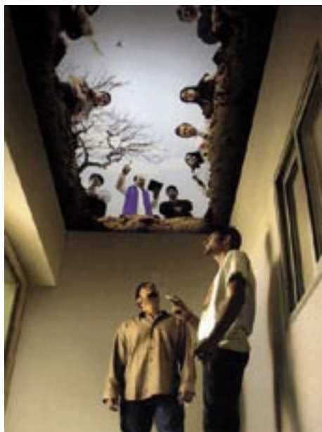
Arbejdspladsens rygerum med tankevækkende loftsmaleri